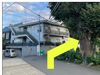
大きな木のある角を お墓に沿って右折し直進