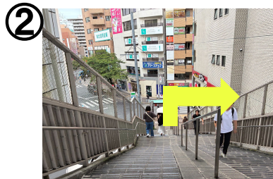
階段を降り右方向へ