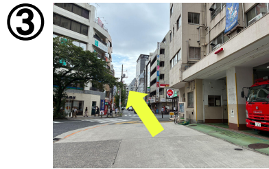
消防署の前を直進