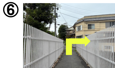
橋を渡り終えたら右折