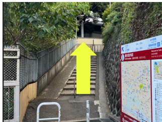
左手の階段を上る