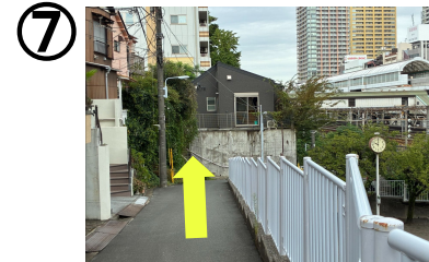
黒い建物がティーンズ日暮里です