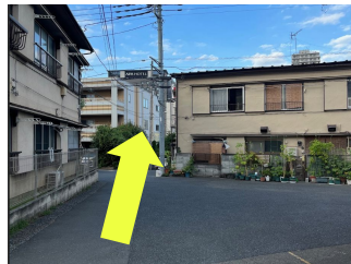
電柱の横の狭い道に入る