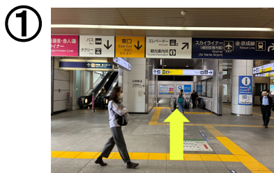
北改札出て東口方面へ進む