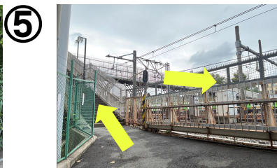
高架をぐり、橋を渡る