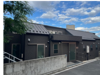
老人ホームを通り過ぎると 先にティーンズ日暮里があります