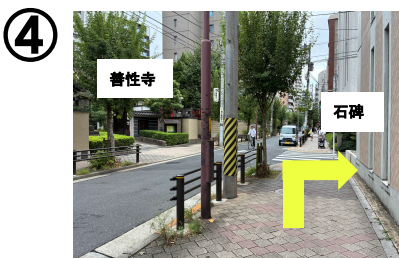
善性寺のある角を右折。 王子街道の石碑が目印です。