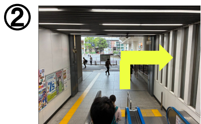
エスカレーターを折り右折