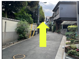
天王寺の壁に沿って直進