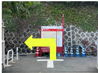
南改札出て谷中方面へ進む