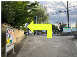
突き当りのT字路を左折