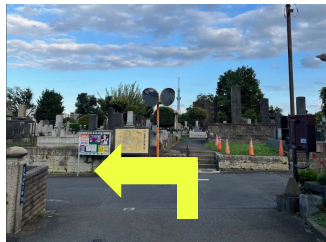
突き当りを左折 スカイツリーが正面に見えます。