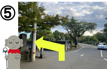
お地藏さんのある角を左折