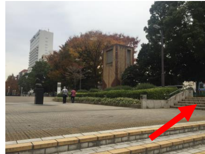
②公園の階段をのぼり、 右手にある横断歩道を渡る