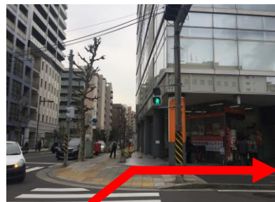
⑤ 公園を右手に、郵便局前の横断歩道を渡り、右に曲がる