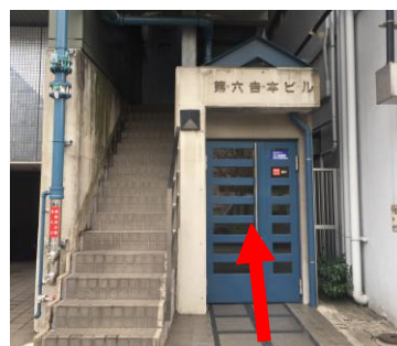
⑥ 第6吉本ビルに到着(左手)青いドアからエレベーターで2階へ(階段からは上がりません)