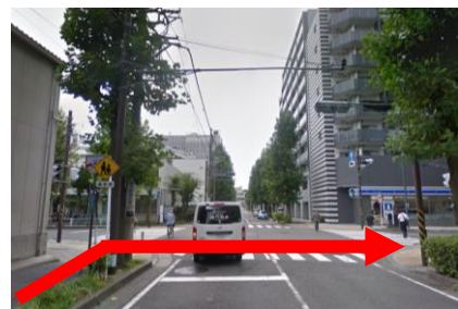
④ ローソンのある交差点を右折し、まっすぐ進む