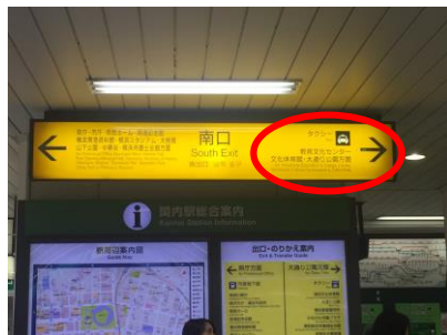
① 関内駅の南口・大通公園方面の出口をでる