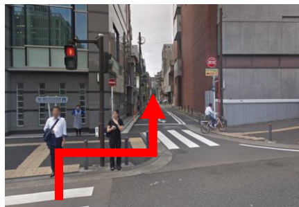
② かながわ信用金庫前の横断歩道を渡り、一方通行の道をまっすぐ進む