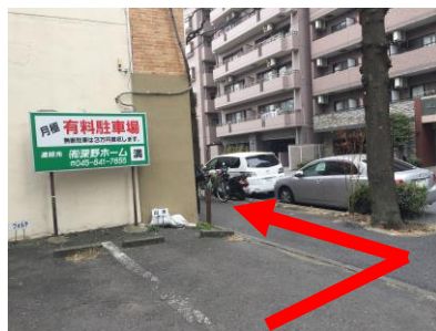
③ 左手に有料駐車場が見えたら左にまがる