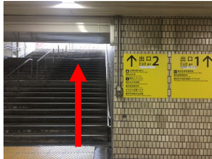
①伊勢佐木長者町駅の 2番出口の階段をのぼる