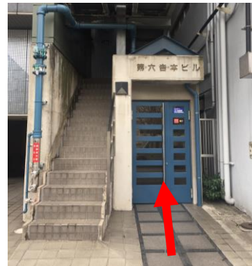
④第6吉本ビルに到着(右手) 青いドアからエレベーターで 2階へ(階段からは上がりません)