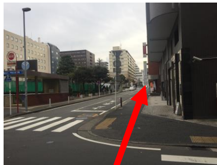
③大きな公園(テニスコート)を 左手に見ながら、まっすぐ進む