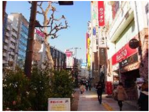
①両駅直通のB5出口 神保町方面に10秒ほど進む