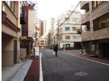
③突き当たりを左折し、数十秒 直進