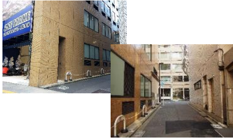
②最初の角(スポーツ用品店の手前)を 右折。突き当たりまで数十秒進む