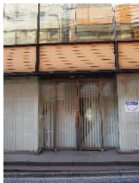
⑤波岡歯科の目の前にTEENS御茶ノ水。 正面のドアからお入りください