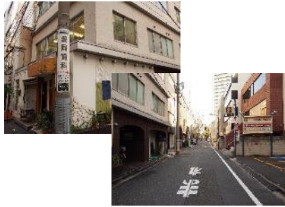
④波岡歯科と看板のある角を右折。 1分ほど進む